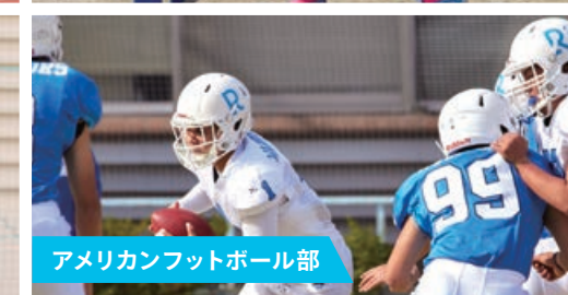
アメリカンフットボール部