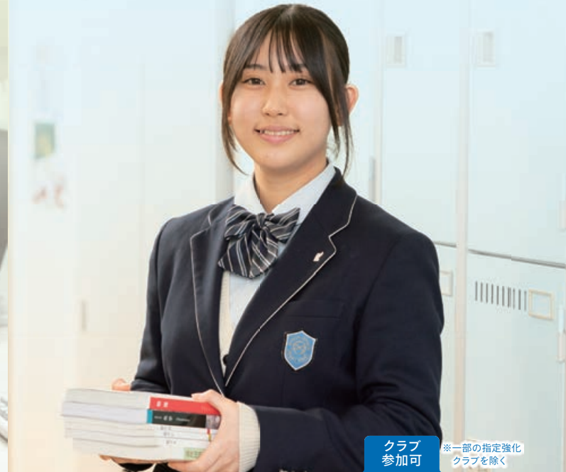
クラブ参加可 一部の指定強化クラブを除く