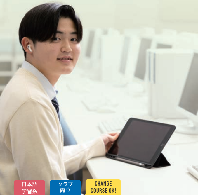
日本語学習系 クラブ両立 CHANGE COURSE OK!