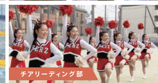
チアリーディング部